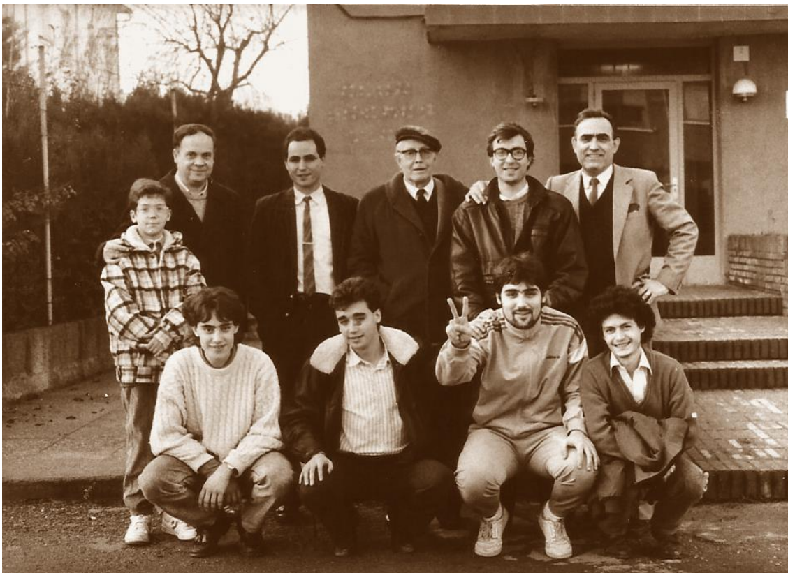
En una foto antiga amb el Sant Andreu. Al seu davant el seu fill

En el decurs de la seva vida va defensar el colors del Barcelona, Ruy López Paluzíe, Unió Graciencia d'Escacs, Barcinona, quedant en la majoria d'ells campió de Catalunya per equips. També va estar jugant un cert temps en el Maspalomas, de Gran Canaria.